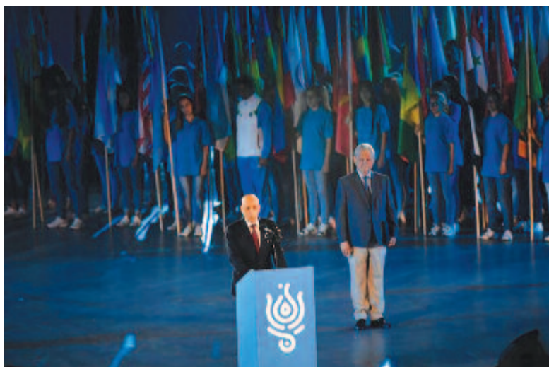
A Nemzetközi Úszósövetség (FINA) elnöke, Julio C. Maglione beszédet mond a 17. vizes világbajnokság megnyitóján a Lánchíd pesti hídfőjénél, a Duna vizén kialakított alkalmi színpadon 2017. július 14-én. Jobbról Tarlós István főpolgármester.

Rendkívül látványos nyitóünnepséggel kezdődött meg péntek este hivatalosan Magyarország történetének legnagyobb sporteseménye, az úszók, nyíltvízi úszók, műugrók, szinkronúszók és vízilabdázók 17. világbajnoksága. A rendezvényt a